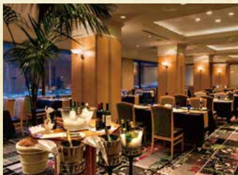
レストラン「フォンタナ」 Restaurant "FONTANA"

お食い初め、七五三、銀婚式、金婚式、ご長寿のお祝いなど 節目を彩る素敵な時間をご家族や大切な方とともにお過ごし ください。プラン特典として、個室をご利用いただけますので 周囲に気がねすることなく、小さなお子さまも一緒に安心して お過ごしいただけます。