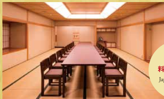
日本料理 「千羽鶴」 料亭街(個室例) Japanese Cuisine “Senbazuru”