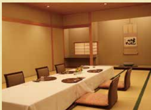
日本料理「千羽鶴」料亭街(個室例) Japanese Cuisine "Senbazuru"