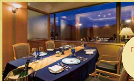
レストラン 「フォンタナ」 (個室例) Restaurant “FONTANA”

特典 ●個室を無料でご利用いただけます。/2時間 (通常個室利用料10,000円~16,700円)